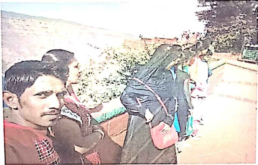
यात्रा का आनंद लेते हुए छात्र