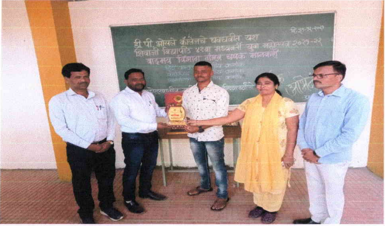
छात्र का सम्मान करते हुए सांस्कृतिक और हिंदी विभाग