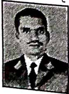
Lokhande R. J. YCM College, Karmala, Dist. Solapur.