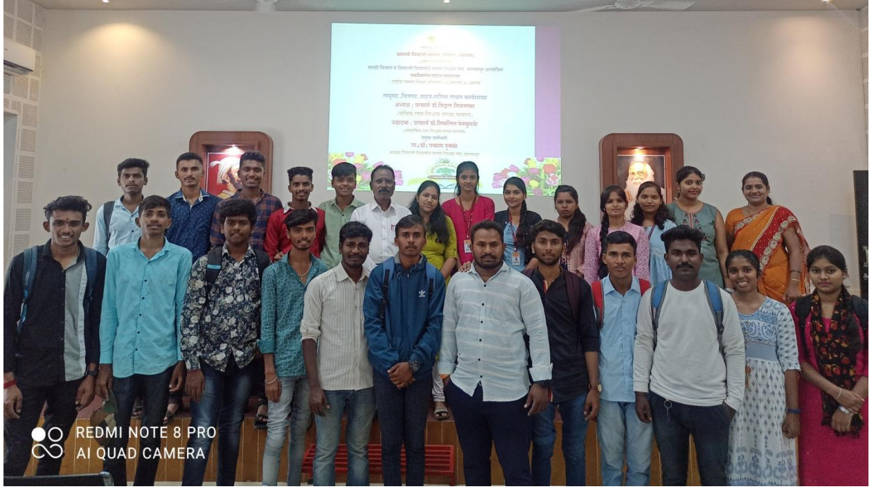
(सदर कार्यशाळेस सहभागी विद्यार्थी)