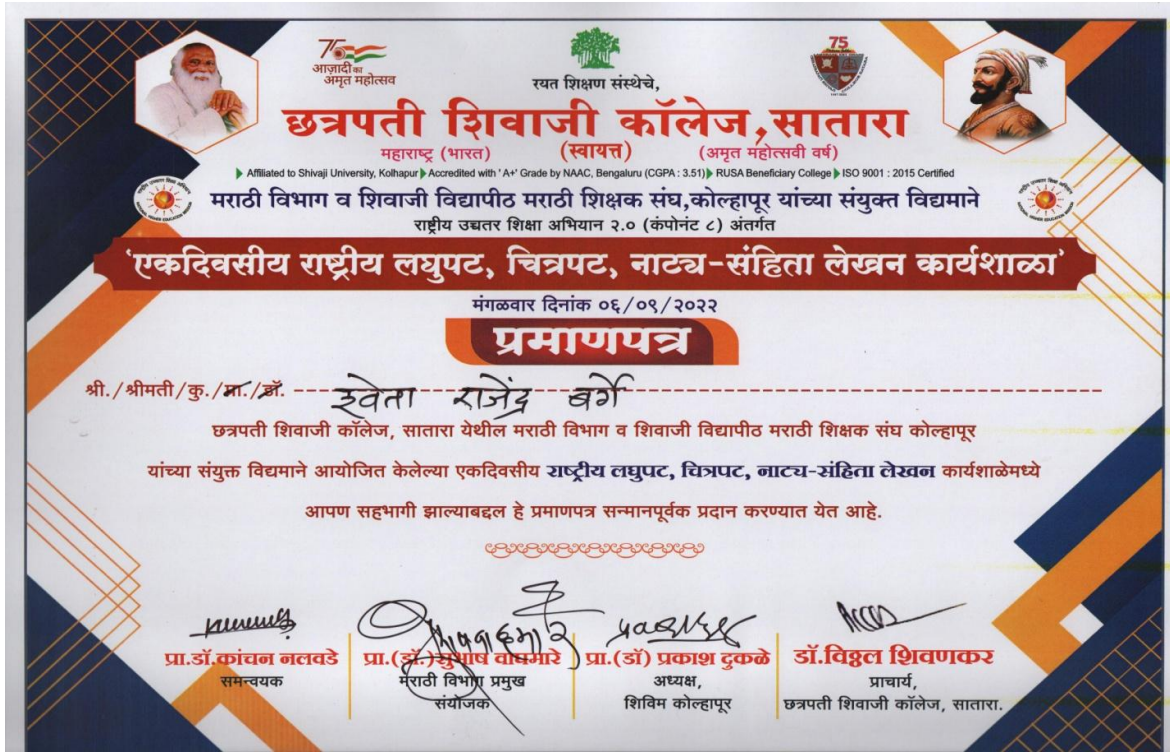
(सदर कार्यशाळेस उपस्थित विद्यार्थ्यांचे प्रमाणपत्र )