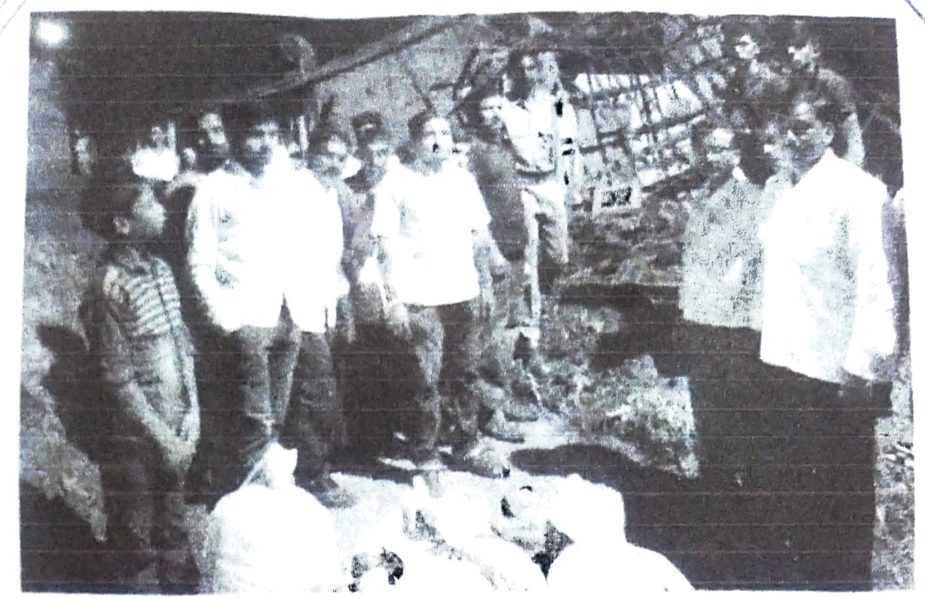
गडहिंग्लज: पूरग्रस्तासाठी जमा केलेले साहित्य.