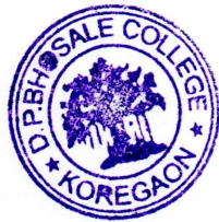
Principal, D. P. Bhosale College, Koregaon.