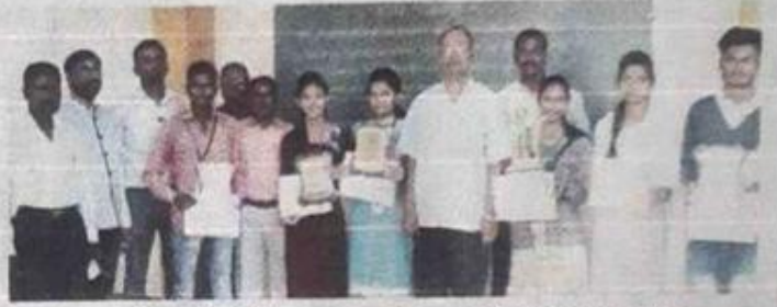
राज्यस्तरीय स्पर्धेसाठी निवड झालेल्या विद्यार्थ्यांसमवेत कॉलेजचे प्राध्यापक.